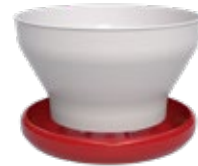
Comedero Infantil P50

Fabricado en polipropileno, se utiliza en las líneas de comedor para alimentar a las aves en los primeros días de vida.