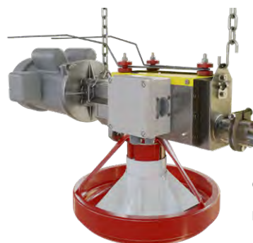
Conjunto Motriz HI-LO 3+