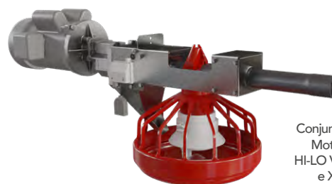
Conjunto Motriz HI-LO VIII e XIV