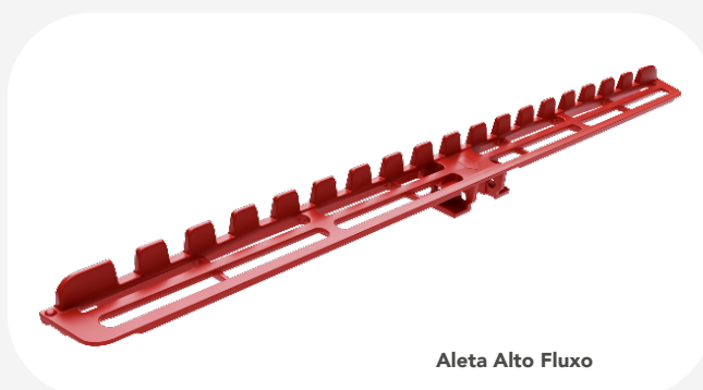
Aleta Alto Fluxo