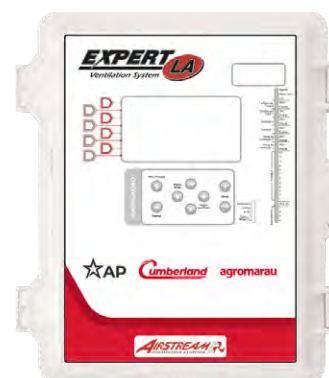
Controlador Expert LA

Os controladores são dotados de sistemas de proteção para maior segurança na operação.